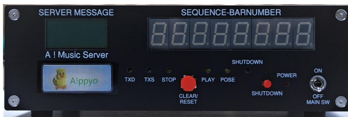
サーバーの表パネル