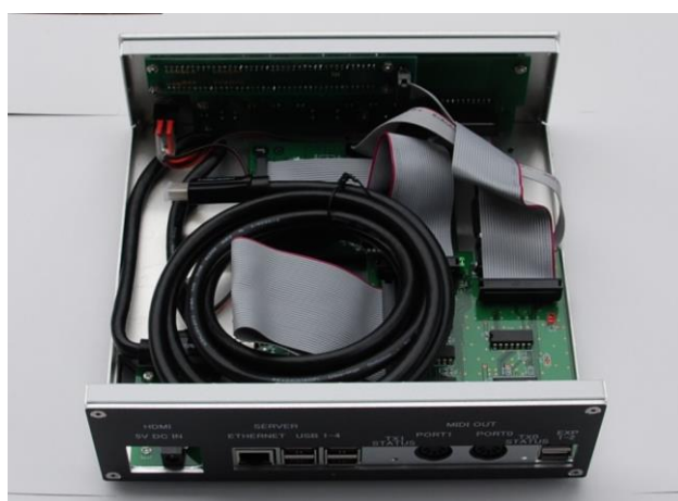
本体内部とHDMIケーブル

モニターをHDMIで接続する場合は、本体ケースカバーを取り外し、ケース内のHDMIケーブルを背面の空き穴から外部に出してご利用ください。(本体ケースに内蔵されたHDMIケーブルは、Raspberry Pi に接続済です。)