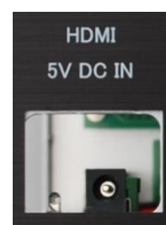
5V DC IN

5VDC IN のDCプラグに付属のACアダプターを接続します。(MAINスイッチはOFFにしておいてください。)